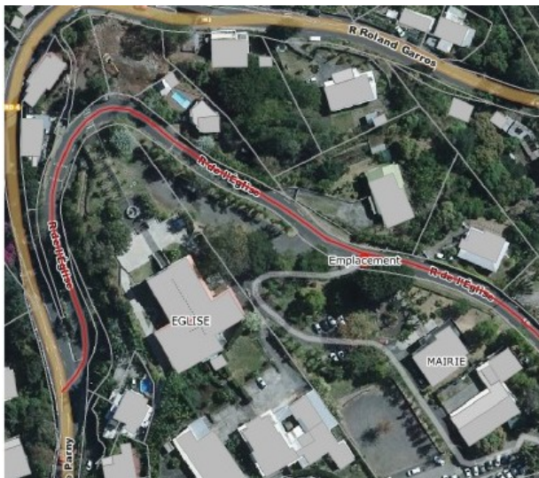
Bois de Nêfles – Proximité de la Mairie annexe